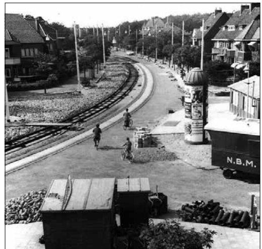
De vernieuwing van tramsporen, wegdek en trottoirs op de Nieboerweg, voorjaar 1962. Rechts staat nog de reclamezuil.

„Het asfalteren van de Nieboerweg, begin 1962, was ook indrukwekkend. Een enorme operatie. Mijn vader heeft daar nog foto's van nagelaten. Vóór die tijd lagen er kinderhoofdjes