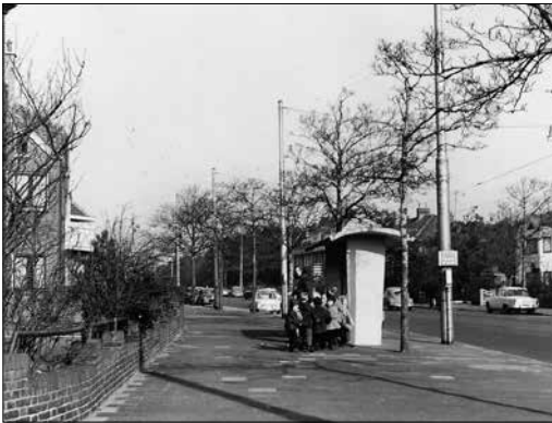
De oude tramhalte van lijn 12 richting Hollands Spoor, bij de hoek Nieboerweg-Laan van Poot, begin jaren zestig.

op de Nieboerweg en de tramhaltes stonden op een andere plek: eentje bij ons om de hoek, voor het huis van Crommelin, en de andere diagonaal daartegenover, vlakbij de kruising Nieboerweg-Laan van Poot. Bij de asfaltering zijn de haltes dicht bij het kinderziekenhuis geplaatst. Schuin tegenover ons huis, tussen de Mezenlaan en de Laan van Poot, stond op een soort eilandje ook nog zo'n mooie ouderwetse aanplakzuil in de vorm van een peperbus. In de jaren zeventig is die opeens verdwenen.”