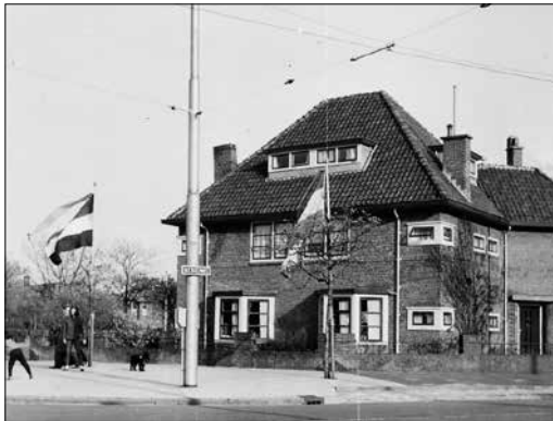
Het hoekpand Mezenlaan-Nieboerweg met de twee vlaggenmasten

„O, ik weet nog iets leuks! Op Koninginnedag en andere nationale feest- of herdenkingsdagen, voerden mijn vader en Crommelin altijd een kleine ceremonie op, want dan werd bij ons en bij hen in de voortuin de Nederlandse vlag gehesen. We hadden allebei een vlaggenmast bij het huis staan. Doorgaans mocht een van de dochters uit de beide gezinnen het ritueel voltrekken. Daarbij moest je goed opletten dat de vlag de grond niet raakte, want dat is een doodzonde. Het uitvouwen, bevestigen en hijsen van de vlaggen – en soms ook de wimpels - werd begeleid door signalen van een bootsmansfluitje waarop mijn vader en Crommelin bliezen. Het ging allemaal met militaire precisie: de twee